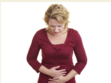
Stress visar sig ofta i fysiska symptom