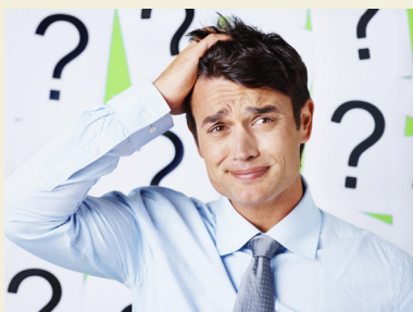
Ugglapraktikens screening ger svar om hälsoläget på företaget

Bland kunderna märks Ericsson, Alecta, Skandia, Microsoft, Skansen m.fl.